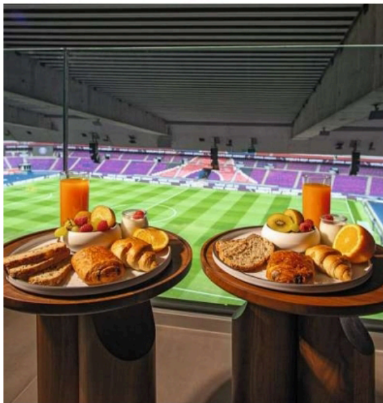
10. Certes, elle est très chère, cette suite unique au Parc des Princes, mais qui aime ne compte que les buts. 11. Une vraie bénédiction, à Anvers, l'ancien monastère avec son jardin de simples et sa chapelle... Un havre de paix multi-étoilé.